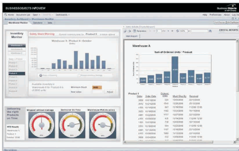
Figura 1: Contenido de Xcelsius® y Crystal Reports® ubicado en Crystal Reports Server

El software Crystal Reports® Server le ayuda a ver, compartir, programar y proporcionar de modo seguro informes diseñados con el software Crystal Reports y cuadros de mando del software Xcelsius®. El uso de un solo servidor para gestionar tanto informes como cuadros de mando reduce los costes de implementación y operativos.