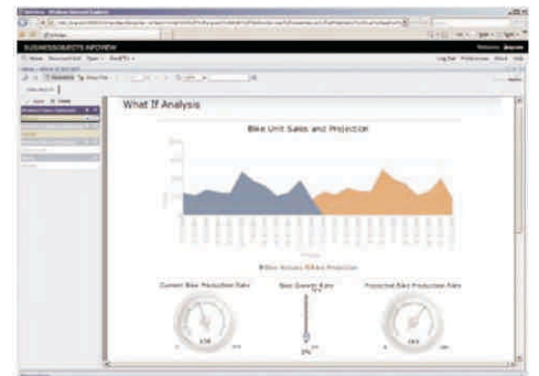
Figura 3: Crystal Reports® Server: Interfaz de usuario final

El visor de informes interactivo y en entorno web incluido con Crystal Reports Server requiere poca formación, o ninguna, y permite imprimir, exportar y realizar desgloses en gráficos y grupos. Puede aprovechar los paneles de parámetros incluidos en los informes, ordenar controles y permitir el uso de Flash integrado para aumentar la productividad y reducir el número de informes necesario para responder a preguntas empresariales cruciales.